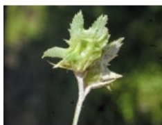
à inconnu observée le 5 mai 2013 par Liliane Roubaudi

Réseau Tela botanica, Programme Flora Data, version dynamique.