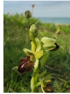
à inconnu observée le 26 mai 2012 par Claire Felloni

Réseau Tela botanica, Programme Flora Data, version dynamique.