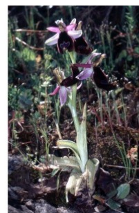
à inconnu observée le 12 avril 2003 par Liliane Roubaudi

Réseau Tela botanica, Programme Flora Data, version dynamique.