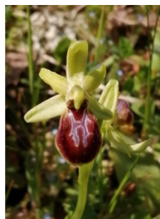
à inconnu observée le 10 avril 2022 par Patrick Ressayre

Réseau Tela botanica, Programme Flora Data, version dynamique.