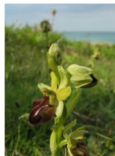
à inconnu observée le 26 mai 2012 par Claire Felloni

Réseau Tela botanica, Programme Flora Data, version dynamique.