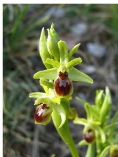
à inconnu observée le 17 avril 2022 par Valery Henriot

Réseau Tela botanica, Programme Flora Data, version dynamique.