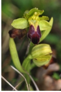
à inconnu observée le 20 avril 2003 par Fabien Kendall

Réseau Tela botanica, Programme Flora Data, version dynamique.