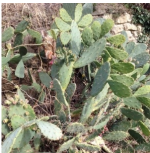
à inconnu observée le 9 février 2014 par Pierre Bonnet

Réseau Tela botanica, Programme Flora Data, version dynamique.