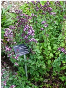
à inconnu observée le 11 septembre 2008 par Alain Bigou

Réseau Tela botanica, Programme Flora Data, version dynamique.