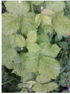
à inconnu observée le 16 mai 2018 par MADY Pirard

Réseau Tela botanica, Programme Flora Data, version dynamique.