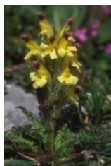
à inconnu observée le 9 juillet 2008 par Bernard Machetto

Réseau Tela botanica, Programme Flora Data, version dynamique.