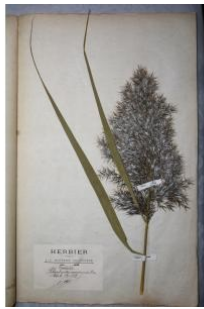
à inconnu observée le 1 septembre 1883 par Herbier Guittot

Réseau Tela botanica, Programme Flora Data, version dynamique.