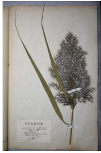
à inconnu observée le 1 septembre 1883 par Herbier Guittot

Réseau Tela botanica, Programme Flora Data, version dynamique.