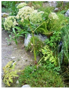
à inconnu observée le 11 septembre 2008 par Alain Bigou

Réseau Tela botanica, Programme Flora Data, version dynamique.