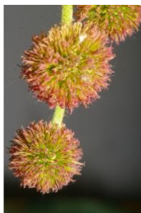
à inconnu observée le 2 mai 2006 par Michel Pourchet

Réseau Tela botanica, Programme Flora Data, version dynamique.