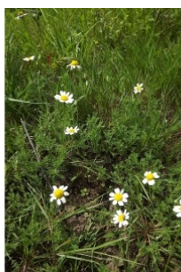
à inconnu observée le 9 juillet 2014 par Florent Beck

Réseau Tela botanica, Programme Flora Data, version dynamique.