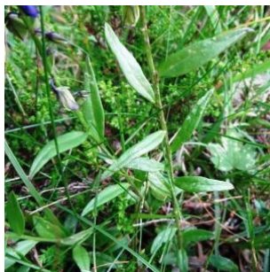
à inconnu observée le 6 août 2014 par Alain Bigou

Réseau Tela botanica, Programme Flora Data, version dynamique.