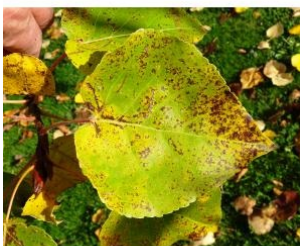
à inconnu observée le 25 octobre 2015 par Alain Bigou

Réseau Tela botanica, Programme Flora Data, version dynamique.