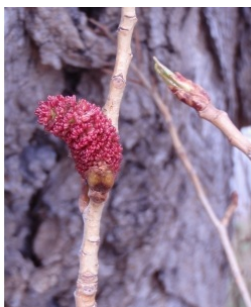
à inconnu observée le 5 avril 2012 par Genevieve Botti

Réseau Tela botanica, Programme Flora Data, version dynamique.