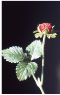
à inconnu observée le 18 août 2002 par Liliane Roubaudi

Réseau Tela botanica, Programme Flora Data, version dynamique.