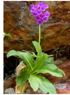
à inconnu observée le 12 juin 2005 par Alain Bigou

Réseau Tela botanica, Programme Flora Data, version dynamique.