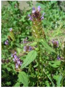
à inconnu observée le 5 juillet 2011 par David Mercier

Réseau Tela botanica, Programme Flora Data, version dynamique.