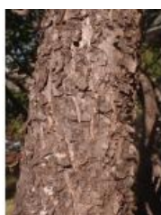
à inconnu observée le 24 août 2013 par Genevieve Botti

Réseau Teia botanica, Programme Flora Data, version dynamique.