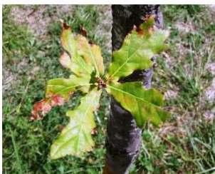
à inconnu observée le 4 septembre 2018 par Alain Bigou

Réseau Tela botanica, Programme Flora Data, version dynamique.