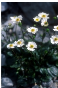
à inconnu observée le 14 juin 2003 par Philippe Thomas

Réseau Tela botanica, Programme Flora Data, version dynamique.