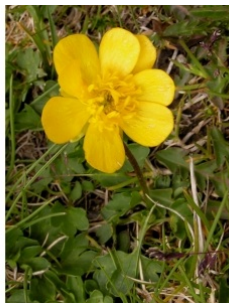
à inconnu observée le 12 juin 2005 par Alain Bigou

Réseau Tela botanica, Programme Flora Data, version dynamique.