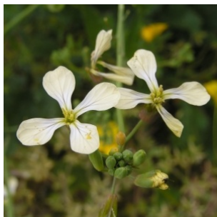
à inconnu observée le 14 mai 2005 par Alain Bigou

Réseau Tela botanica, Programme Flora Data, version dynamique.