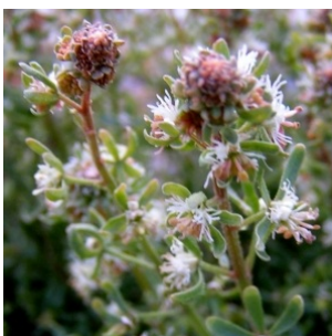
à inconnu observée le 27 novembre 2004 par Alain Bigou

Réseau Tela botanica, Programme Flora Data, version dynamique.