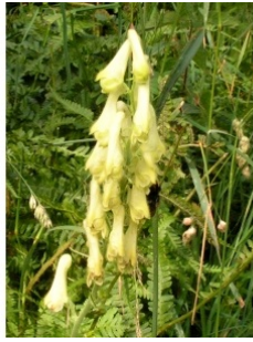
à inconnu observée le 2 août 2004 par Alain Bigou

Réseau Tela botanica, Programme Flora Data, version dynamique.