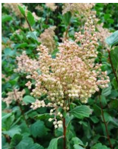
à inconnu observée le 26 juillet 2017 par Alain Bigou

Réseau Tela botanica, Programme Flora Data, version dynamique.