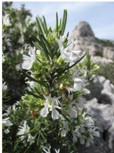
à inconnu observée le 4 avril 2011 par Marie Portas

Réseau Tela botanica, Programme Flora Data, version dynamique.