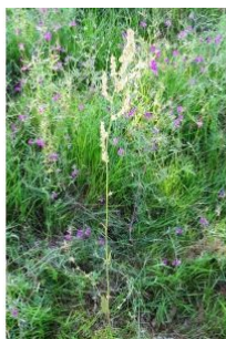
à inconnu observée le 20 mai 2016 par Alain Bigou

Réseau Tela botanica, Programme Flora Data, version dynamique.