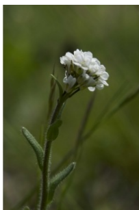
à inconnu observée le 3 juin 2016 par Jean Paul Saint Marc

Réseau Tela botanica, Programme Flora Data, version dynamique.