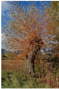
à inconnu observée le 7 novembre 2014 par Société Botanique Gentiana

Réseau Tela botanica, Programme Flora Data, version dynamique.