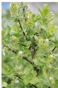
à inconnu observée le 14 juillet 2016 par Néhémie Meslage

Réseau Tela botanica, Programme Flora Data, version dynamique.