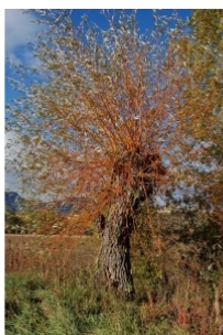
à inconnu observée le 7 novembre 2014 par Société Botanique Gentiana

Réseau Tela botanica, Programme Flora Data, version dynamique.