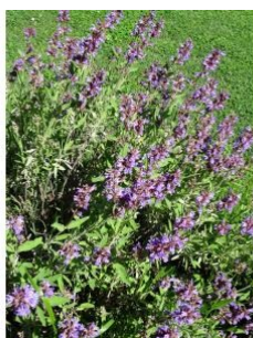
à inconnu observée le 12 mai 2016 par Alain Bigou

Réseau Tela botanica, Programme Flora Data, version dynamique.