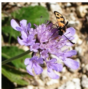
à inconnu observée le 28 septembre 2005 par Alain Bigou

Réseau Tela botanica, Programme Flora Data, version dynamique.