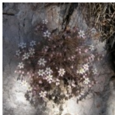
à inconnu observée le 7 juillet 2012 par Alain Bigou

Réseau Tela botanica, Programme Flora Data, version dynamique.