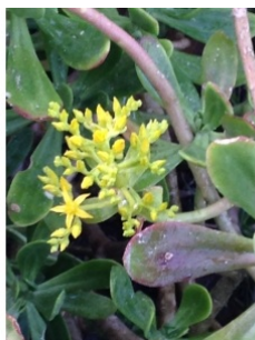
à inconnu observée le 25 mars 2019 par HERVE Gros

Réseau Tela botanica, Programme Flora Data, version dynamique.