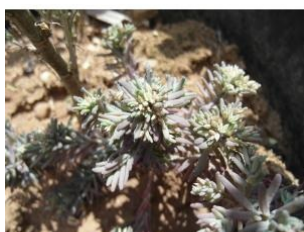
à inconnu observée le 18 juin 2015 par Martine Gourlain

Réseau Tela botanica, Programme Flora Data, version dynamique.