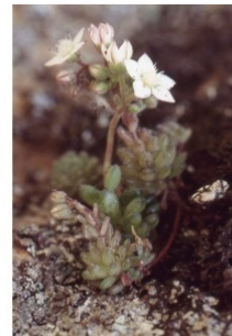
à inconnu observée le 27 mai 1995 par Liliane Roubaudi

Réseau Tela botanica, Programme Flora Data, version dynamique.