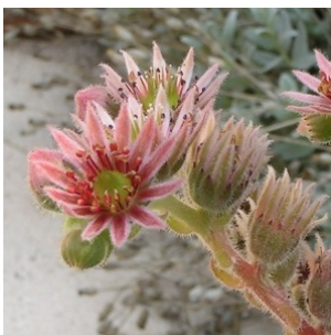
à inconnu observée le 30 juillet 2004 par Alain Bigou

Réseau Tela botanica, Programme Flora Data, version dynamique.