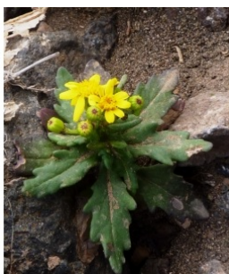
à inconnu observée le 20 janvier 2013 par Ans Gorter

Réseau Tela botanica, Programme Flora Data, version dynamique.