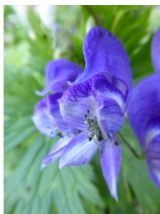
à inconnu observée le 12 août 2018 par François Munoz

Réseau Tela botanica, Programme Flora Data, version dynamique.