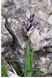
à inconnu observée le 1 mai 2013 par Alain Bigou

Réseau Tela botanica, Programme Flora Data, version dynamique.