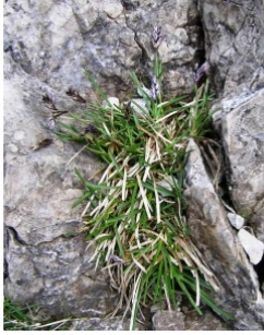
à inconnu observée le 1 mai 2013 par Alain Bigou

Réseau Tela botanica, Programme Flora Data, version dynamique.