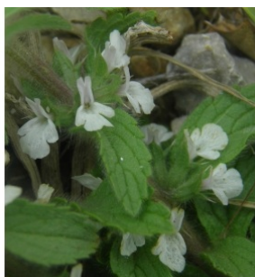
à inconnu observée le 1 mai 2015 par Ans Gorter

Réseau Tela botanica, Programme Flora Data, version dynamique.