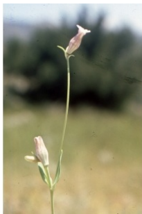
à inconnu observée le 8 mai 2006 par Liliane Roubaudi

Réseau Tela botanica, Programme Flora Data, version dynamique.