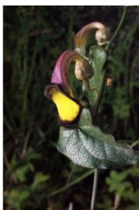
à inconnu observée le 23 avril 2014 par Liliane Roubaudi

Réseau Tela botanica, Programme Flora Data, version dynamique.