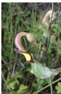
à inconnu observée le 23 avril 2014 par Liliane Roubaudi

Réseau Tela botanica, Programme Flora Data, version dynamique.