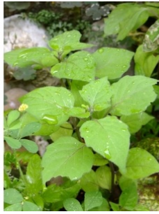
à inconnu observée le 4 juillet 2010 par Yoan Martin

Réseau Tela botanica, Programme Flora Data, version dynamique.