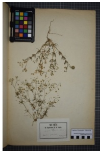
à inconnu observée le 1 septembre 1859 par Herbier Pontarlier-marichal

Réseau Tela botanica, Programme Flora Data, version dynamique.